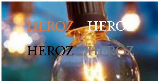
複雑な背景との組合